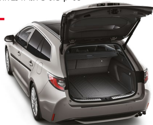
אמבטיה לתא המטען המספקת הגנה מפני לכלוך ומפני החלקה של ציוד וסחורה