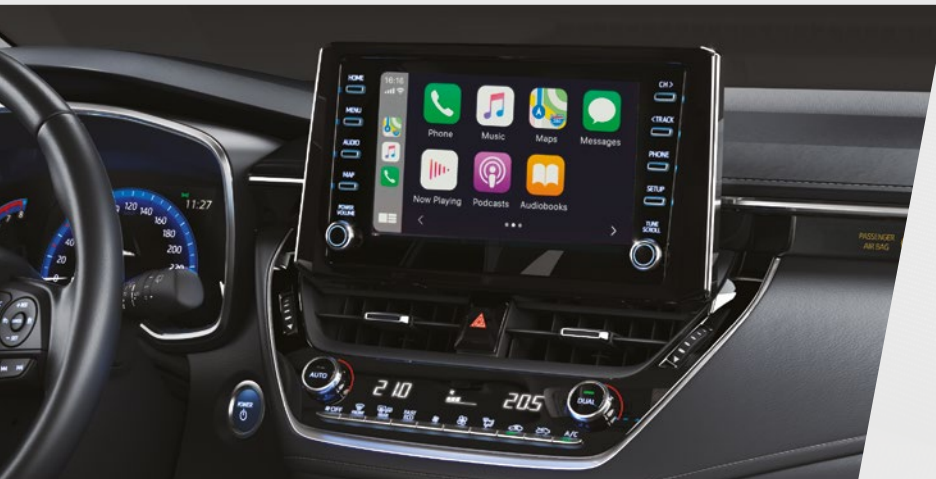
מערכת מולטימדיה 8" דוברת עברית

*השימוש ב-Apple CarPlay כפוף לזמינות ועדכניות האפליקציה בחנות האפליקציות של Apple ולסוג מכשירך. נכון למועד פרסום קטלוג זה, אפליקציית Android Auto אינה זמינה בישראל. **מומלץ לבדוק את תאימות הטלפון הנייד שברשותך למערכת ה-Bluetooth המותקנת ב-COROLLA, אשר הינה מסוג: Toyota Touch 2. את הבדיקה ניתן לעשות בלינק הבא: www.toyota-tech.eu/bluetooth/search.aspx