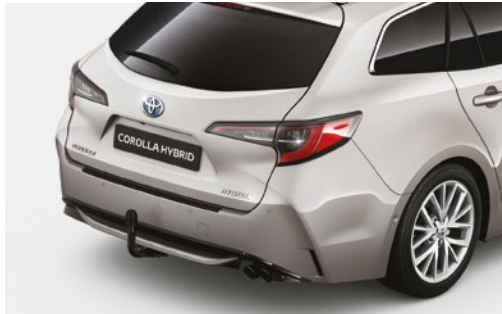
וו גרירה קבוע