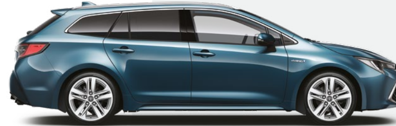
כחול מטאלי 8U6