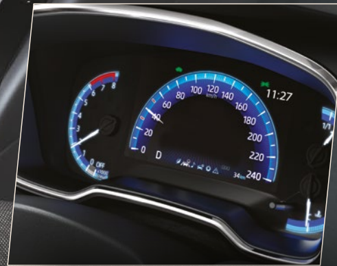
מסך נתונים 7" צבעוני הממוקם בלוח