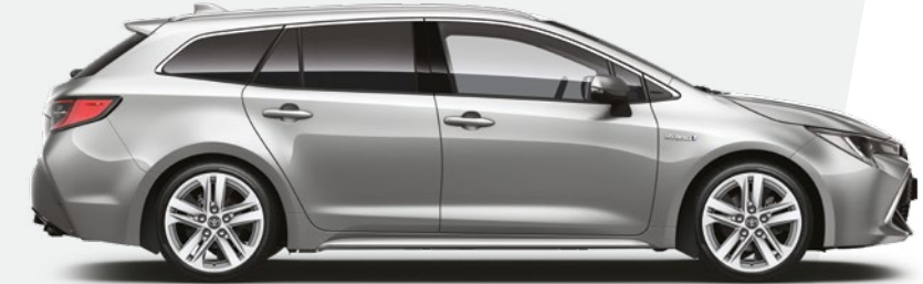
כסוף מטאלי 1F7