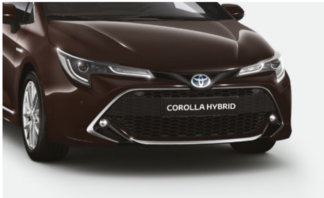
מגן פגוש קדמי שיגרום לרכב שלכם ולכם לבלוט בכביש בניקל, שחור או אדום