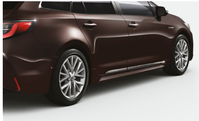
פסי קישוט שיתנו לרכב אופי משלו - בניקל, שחור או אדום