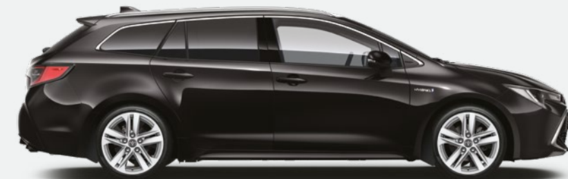
שחור נואר מטאלי 209