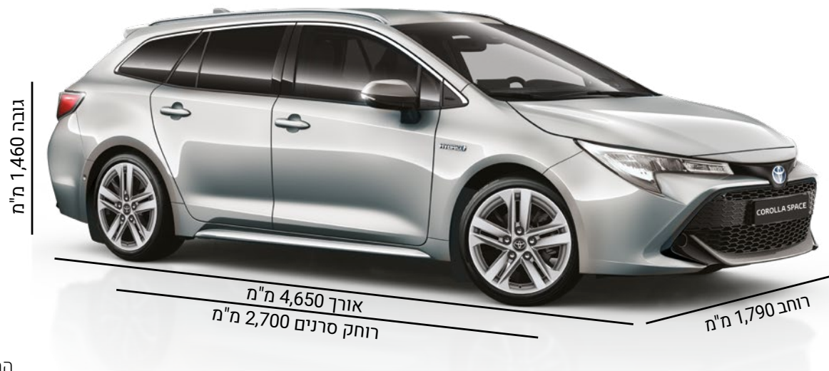
התמונה להמחשה בלבד.