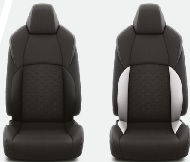
שחור בשילוב אפור* / ריפוד בד שחור

*ריפוד בד שחור בשילוב אפור מגיע בצבעים חיצוניים לבן פנינה מטאלי ושחור נואר מטאלי בדגם ה-SPACE+ בלבד