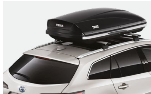
הוסיפו מוטות רוחב, עבור מגוון אביזרי גג ומתקני אופניים