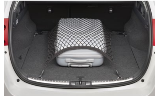
רשת המתחברת אל וויים בתא המטען ומספקת פתרון אידיאלי למניעת החלקה של תיקים ופריטים דומים בתא המטען