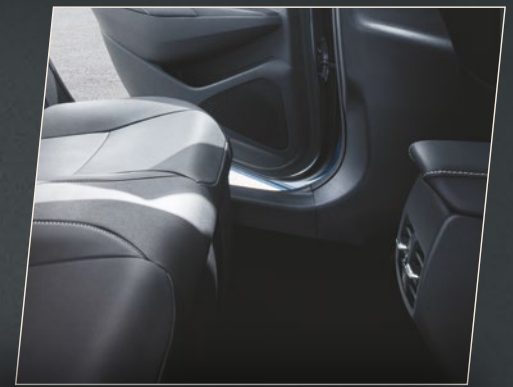
פתיחי מיזוג אחוריים ליושבים במושב האחורי