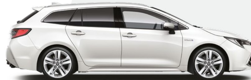
לבן פנינה מטאלי 070