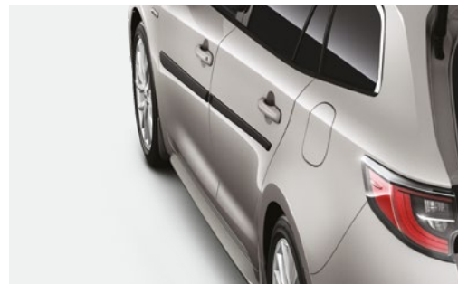
פסי הגנה לדלתות אשר יספקו הגנה מקיפה יותר לרכב שלך