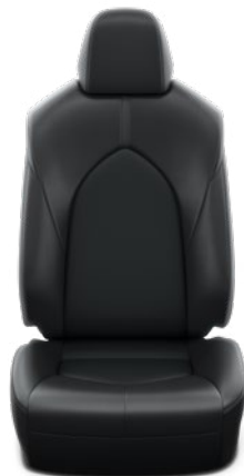
עור שחור ריפוד עור בצבע שחור, מגיע ברכבים עם צבע חיצוני לבן צחור וכסוף יוקרתי.