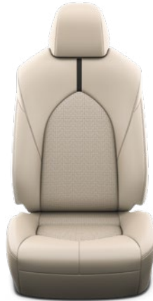
עור בהיר ריפוד עור בצבע בז', מגיע ברכבים עם צבע חיצוני לבן פנינה, שחור.