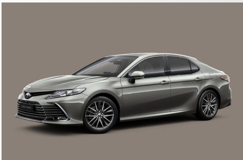
כסוף יוקרתי B-1L5