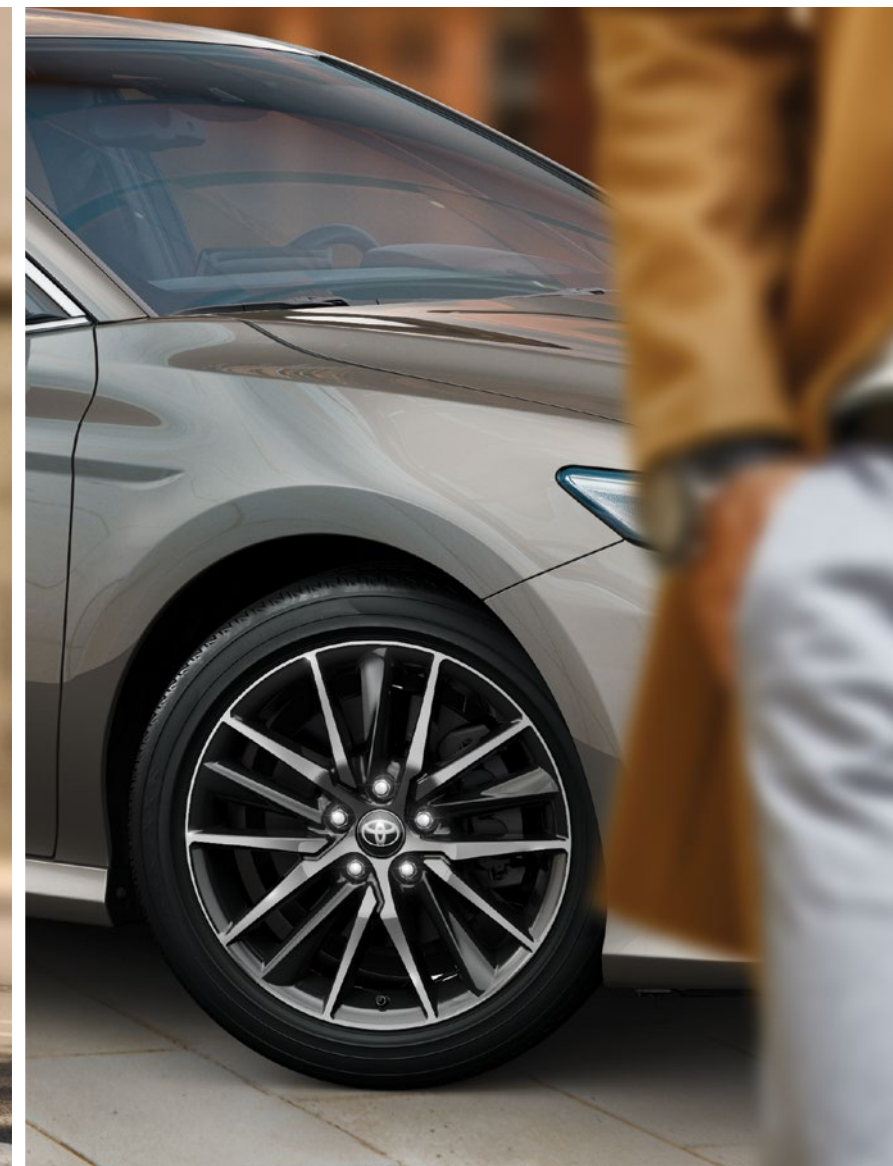
חישוקי סגסוגת קלה 18" המספקים לקאמרי מראה חד ודינמי