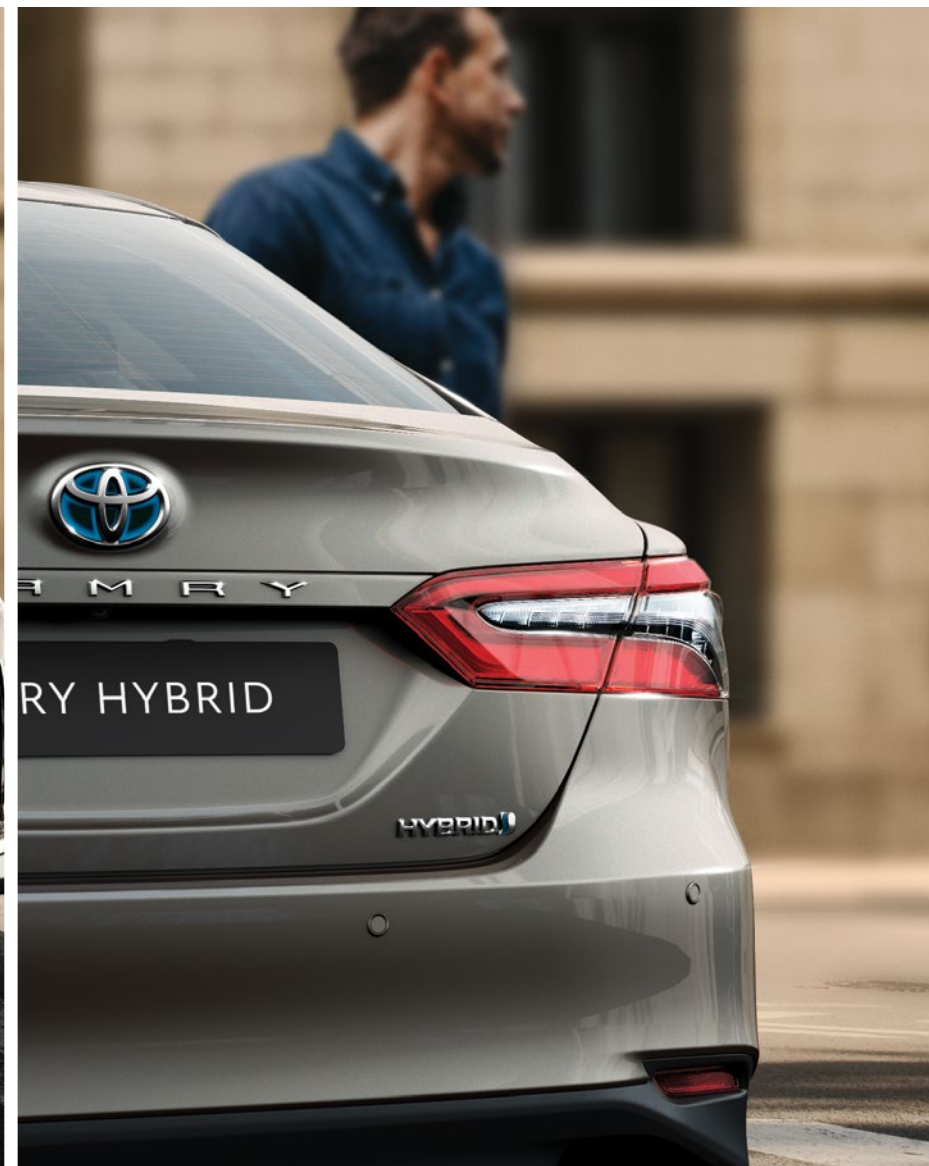
פנסי לד אחוריים שמושכים את העין, במראה עדכני ויוקרתי יותר