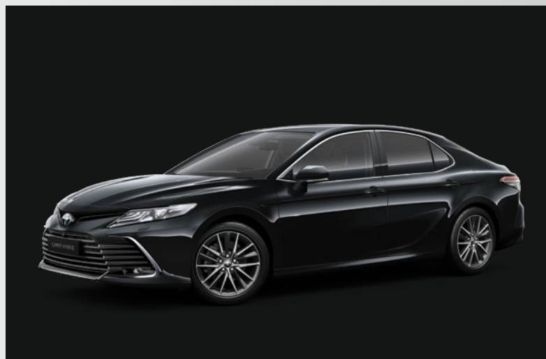
שחור מיקה מטאלי B-218