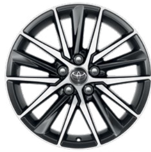
חישוקי סגסוגת קלה 18".