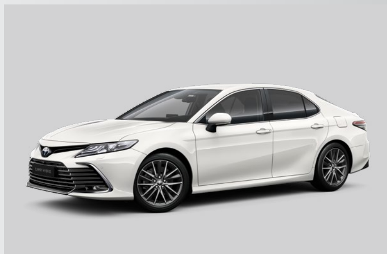
לבן צחור B-040