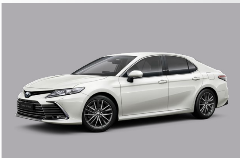
לבן פנינה מטאלי B-089