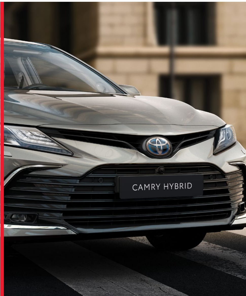
גריל חדש עם חרטום נמוך, רחב ונועז יותר המדגיש את נוכחותה המרשימה והנחושה של הקאמרי החדשה

בקאמרי ההיברידי-חשמלית החדשה יש הכל. היא משלבת בצורה מושלמת את היתרונות של מכונית מנהלים איכותית ועיצוב חדש, מרענן ויוקרתי יותר של חזית הרכב ותא הנוסעים. דבר המוסיף ליכולתה הדינמית של הקאמרי, ומשווה לה נוכחות בולטת וחזקה בכביש. התוצאה: מכונית שגם נראית מצוין, גם נוחה ומרווחת וגם מספקת חווית נהיגה ברמה של מחלקה ראשונה.